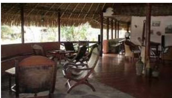
OU Lodge Ucaima